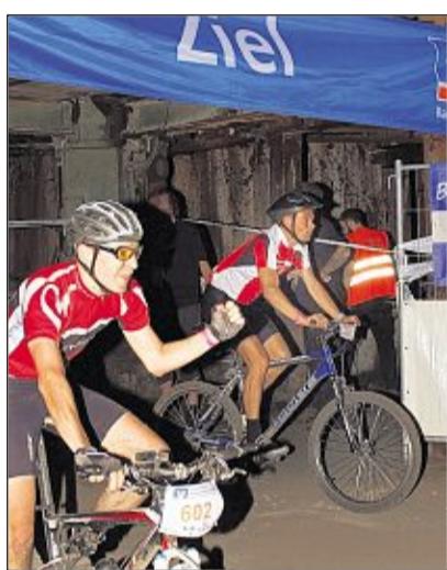
Lohn aller Mühen: Die Zieleinfahrt bei „Bike on Fire“.