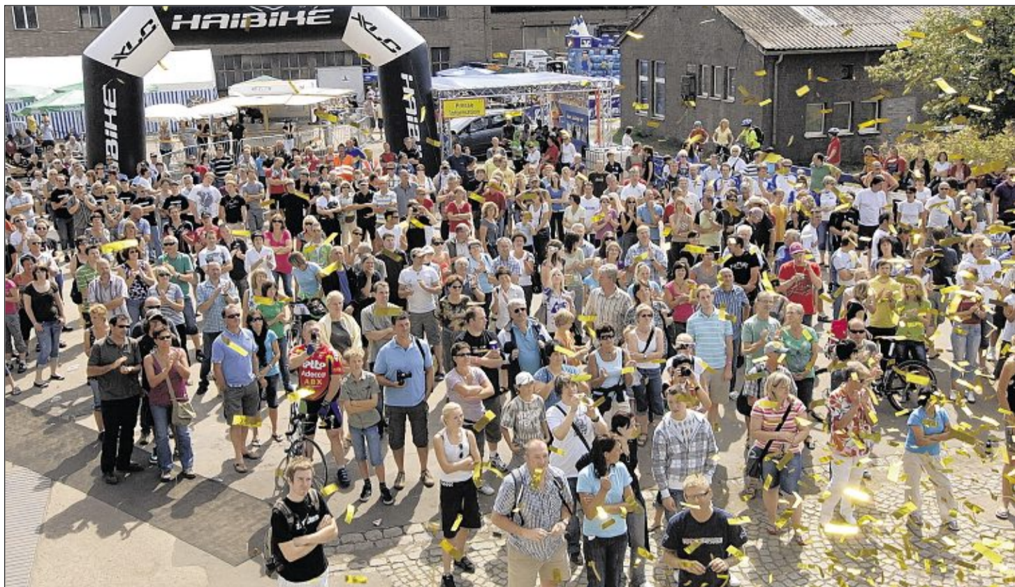
Einen Regen aus Goldfittern erlebten die Besucherscharen bei der Siegerehrung zur 24-Stunden-Mountainbike-WM am Sonntag auf der Hochofenplaza. Quasi ein würdiger Schlusspunkt hinter einer rundum gelungenen Veranstaltung.

Sulzbach-Rosenberg. Die SPD-Frauen treffen sich am Mittwoch, 26. August, ab 19 Uhr im Restaurant Pirner zum Stammtisch. Gäste und Interessierte sind willkommen.