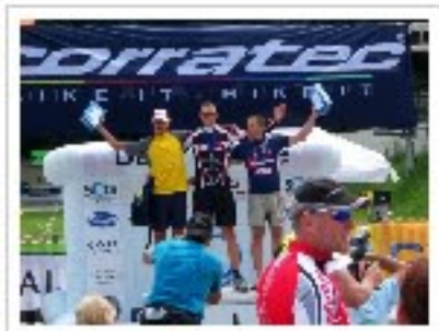
19.8.2007 Sieger Einzelstarter