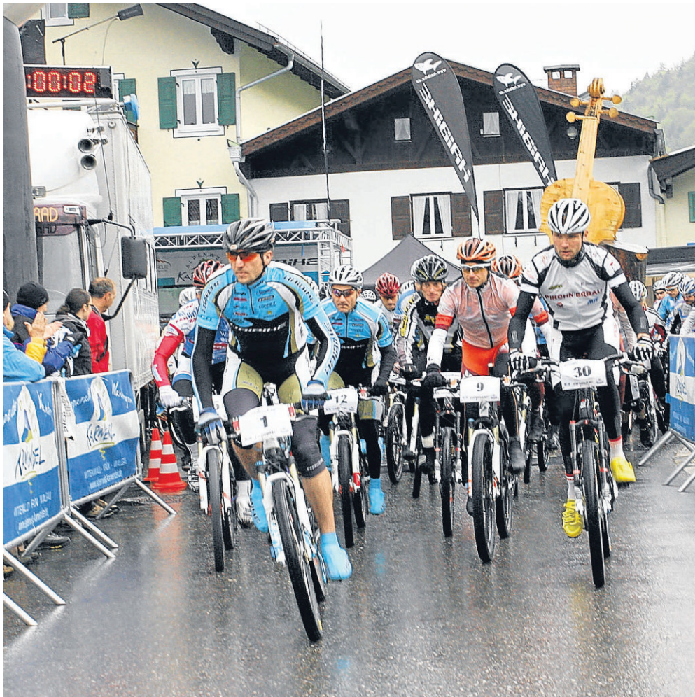
Startschuss im Regen: Für 2011 wünscht sich die Organisatorin besseres Wetter, vielleicht dann im Herbst.

Auch die Verkürzung des Marathons auf 52 Kilometer war keine Spaßaktion. „Es hatte Schnee am Rindberg